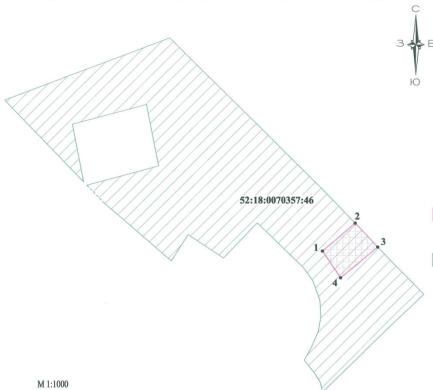
Схема границ публичного сервитута на кадастровом плане территории